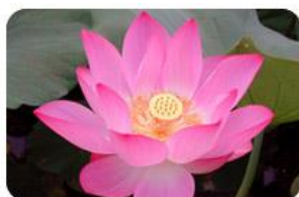
ดอกไม้ประจำโรงเรียน