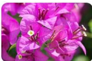
ต้นไม้ประจำโรงเรียน