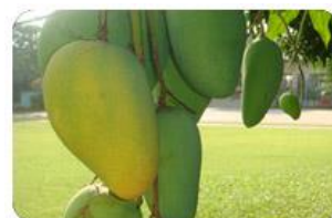
ผลไม้ประจำโรงเรียน